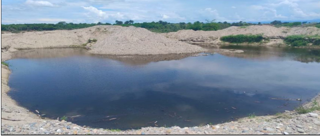
Foto 4. Excavación Mayor en Playa

O Descripción: En la zona de playa del río, se encontró una excavación de 20 metros de diámetro y 2 metros de profundidad, con evidente acopio de gravas y arenas en su borde. Dicha excavación se encuentra dentro del área del contrato 0876-73. (Ver foto 4).