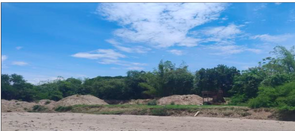
Foto 3. Excavación Irregular en Terraza

O Descripción: Contiguo al hallazgo anterior, se localizó una excavación de forma irregular con una longitud de 30 metros, un ancho de 70 metros y una profundidad variable entre 1.8 y 2.5 metros. Se ubica fuera del área del Contrato 0876-73. (Ver Foto 3).