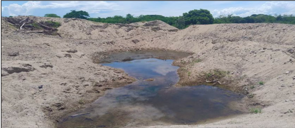
Foto 5. Excavación Menor en Playa

O Descripción: Adyacente a la excavación mayor, se halló una excavación más pequeña en forma de "8", con una longitud de 15 metros por 6 metros de ancho. Que se ubica dentro del área del Contrato de Concesión 0876-73. (Ver foto 5)